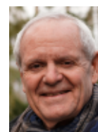
James L. Kent Fotograf