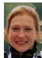
Katrin Wagner-Augustin vierfache Olympiasiegerin im Kanu-Rennsport